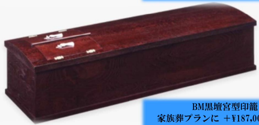
BM黒壇宮型印籠 家族葬プランに +¥187,000 (税込) 一般葬プランに +¥154,000 (税込)