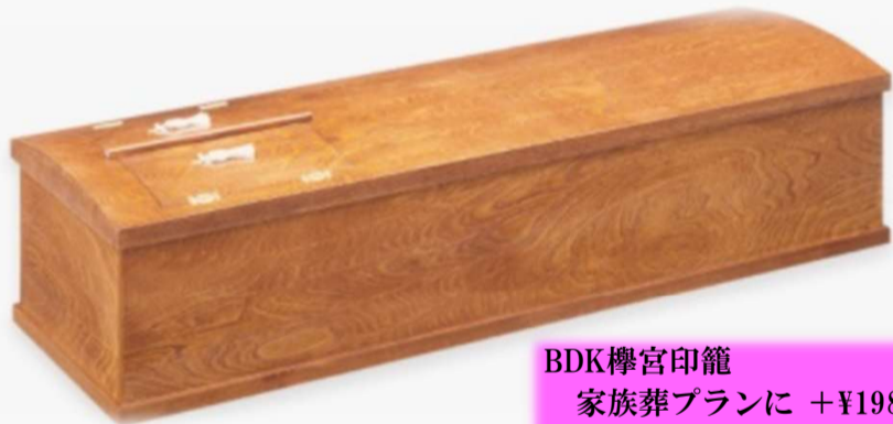
BDK櫛宮印籠 家族葬プランに +¥198,000 (税込) 一般葬プランに +¥165,000 (税込)

各葬儀プランからのグレードアップ価格はそれぞれの御棺に加算額を記載しております。