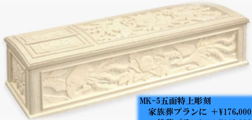
MK-5五面特上彫刻 家族葬プランに +¥176,000 (税込) 一般葬プランに +¥143,000 (税込)