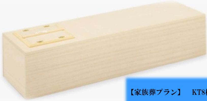
【家族葬プラン】 KT8桐柩乗窓平蓋

各葬儀プランからのグレードアップ価格はそれぞれの御棺に加算額を記載しております。