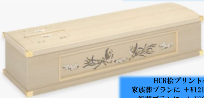
HCR桜プリント布絵 家族葬プランに +¥121,000 (税込) 一般葬プランに +¥88,000 (税込)