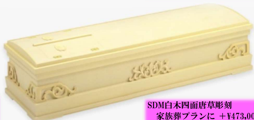
SDM白木四面唐草彫刻 家族葬プランに +¥473,000 (税込) 一般葬プランに +¥440,000 (税込)