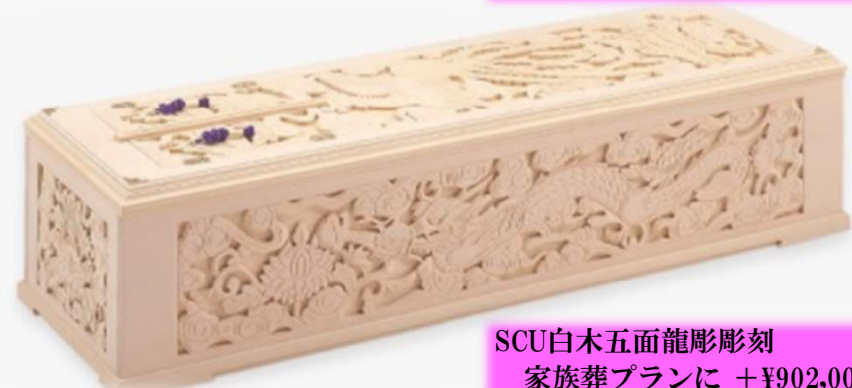
SCU白木五面龍彫彫刻 家族葬プランに +¥902,000 (税込) 一般葬プランに +¥869,000 (税込)