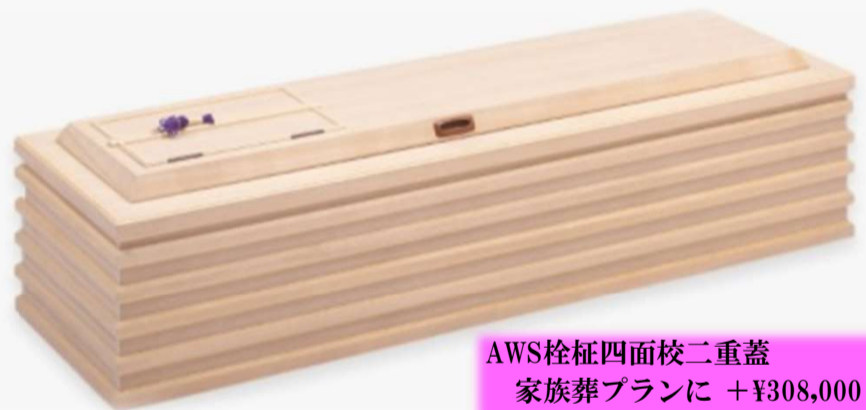
AWS柩柩四面校二重蓋 家族葬プランに +¥308,000 (税込) 一般葬プランに +¥275,000 (税込)