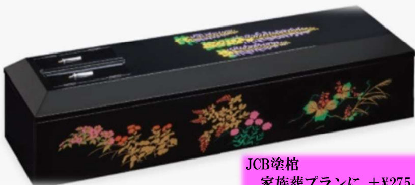
JCB塗棺 家族葬プランに +¥275,000 (税込) 一般葬プランに +¥242,000 (税込)