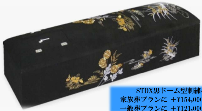
STDX黒ドーム型刺繍棺 家族葬プランに +¥154,000 (税込) 一般葬プランに +¥121,000 (税込)