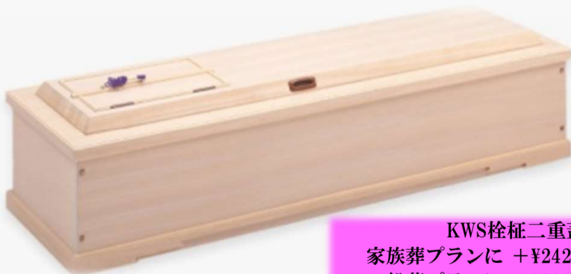
KWS柩柩二重蓋 家族葬プランに +¥242,000 (税込) 一般葬プランに +¥209,000 (税込)